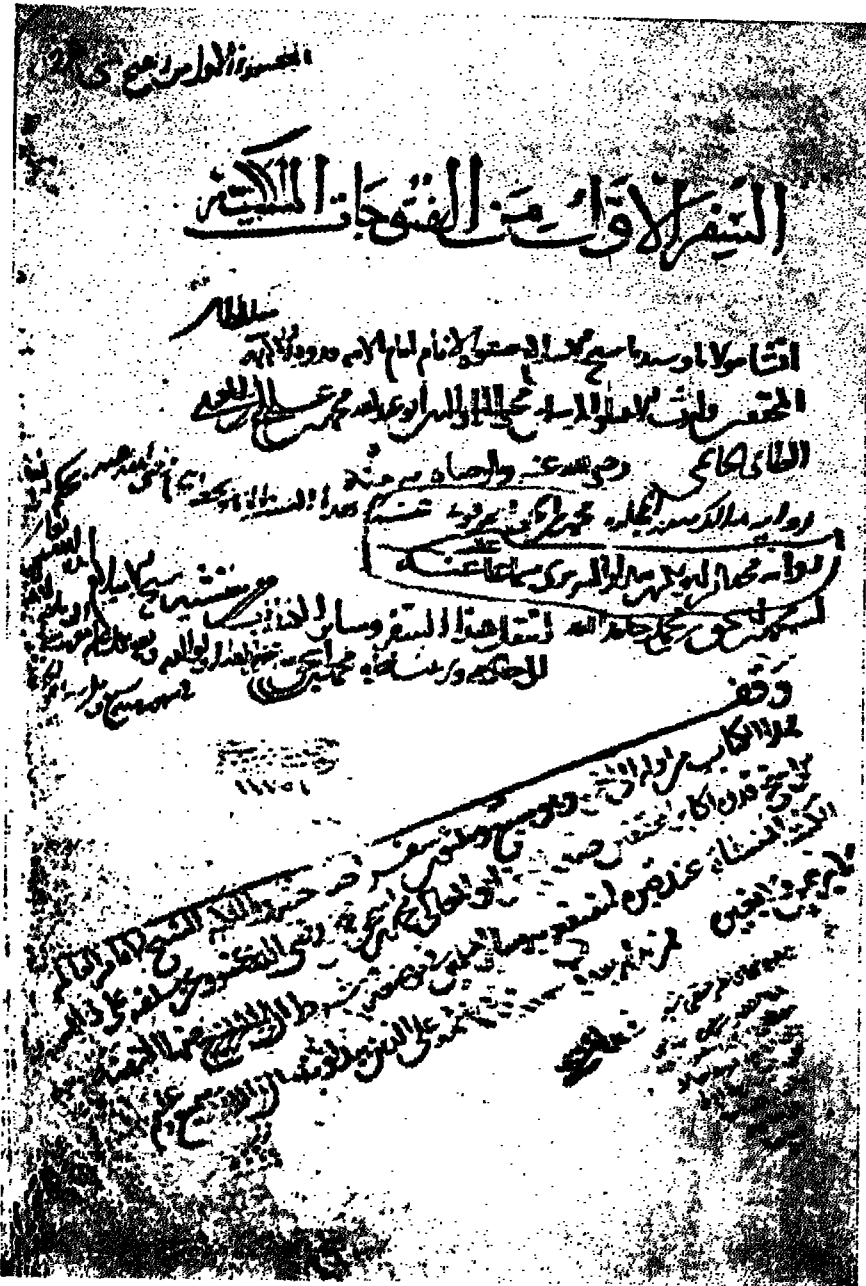
مخطوط قونية (متحف الآثار الإسلامية باستانبول) رقم ١٨٤٥ وهو الأصل الأم للنسخة الثانية للفتوحات ، عام ٦٣٦ هـ